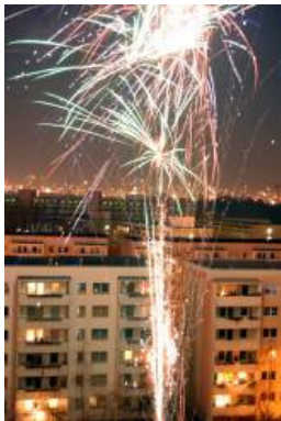
Silvester zwischen Hochhäusern ay aboutpixel user Teufelchen

2 Welche der Bilder gehören zur deutschen Silvestertradition, welche nicht? Kreuze an.