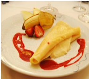
Crepes by aboutpixel user Peiler